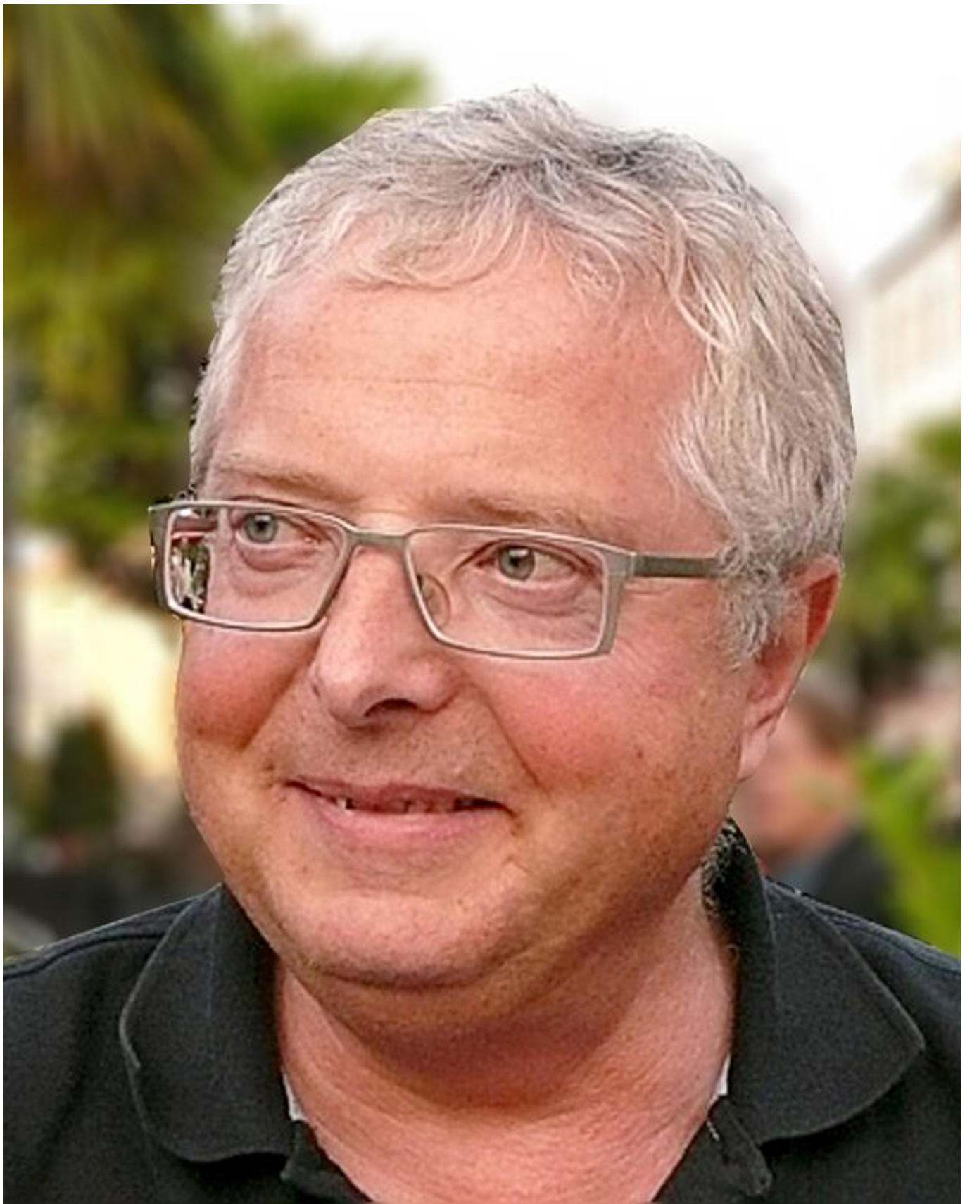
Philosoph und Autor. Chefredakteur der Zeitschrift RotFuchs, früherer Chefredakteur der Tageszeitung Junge Welt.