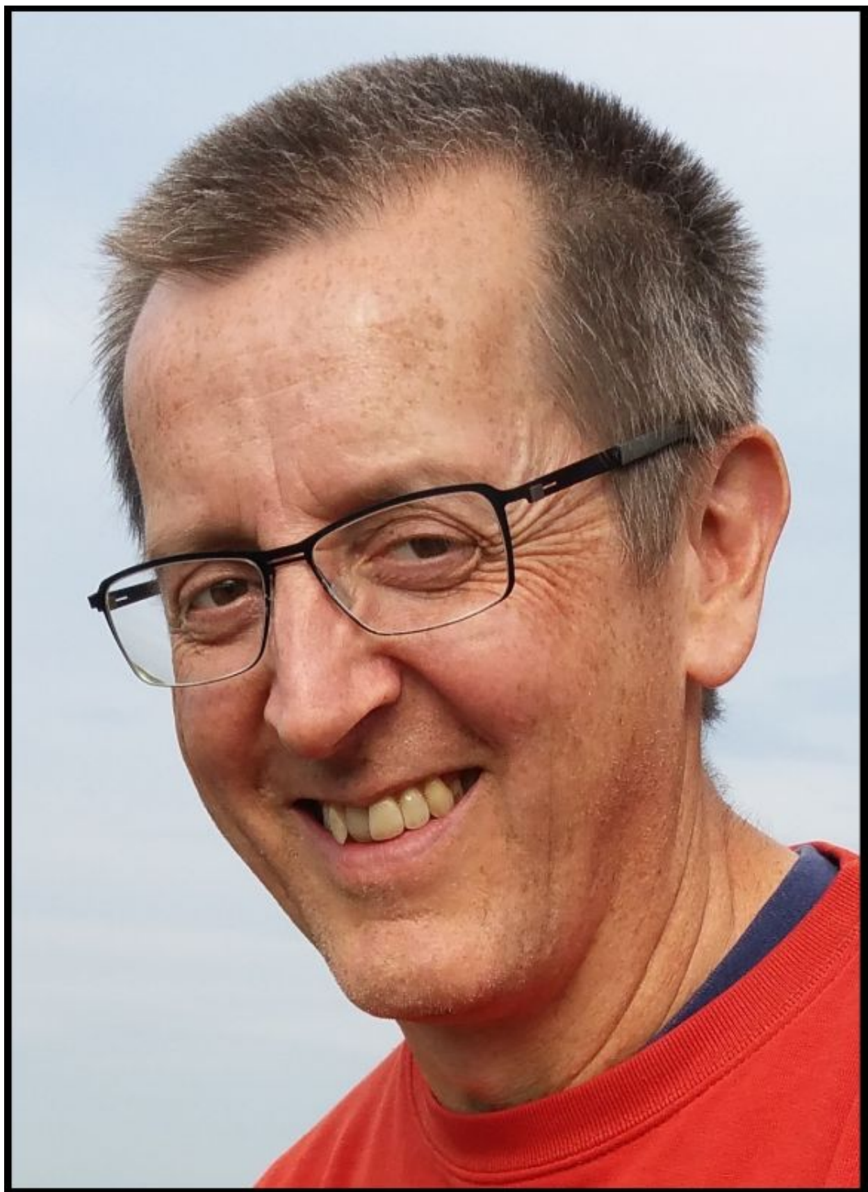
Politikwissenschaftler, wissenschaftlicher Referent für politische Ökonomie der Globalisierung des Instituts für Gesellschaftsanalyse der Rosa-Luxemburg-Stiftung