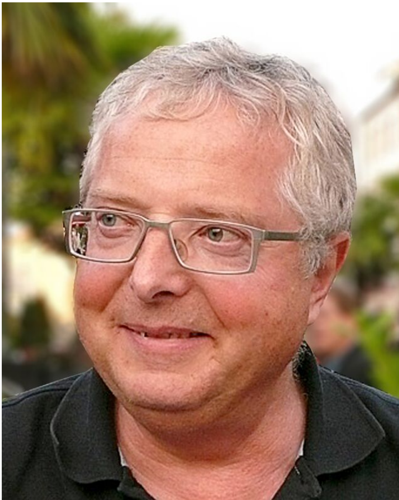
Philosoph und Autor. Chefredakteur der Zeitschrift RotFuchs, früherer Chefredakteur der Tageszeitung Junge Welt.